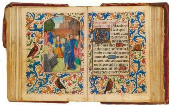
Fig. 6. La resurrezione di Lazzaro , Libro d'Ore Madruzzo. Inizio della sezione delle Ore dei Defunti.

Fino a quando non ci sarà una legge che tuteli il patrimonio manoscritto, comminando severe multe a chi palesemente immette sul mercato fogli di codici smembrati, sarà complicato contrastare gente come il rivenditore in questione. L'unica nostra arma, al momento, è la ricostruzione digitale, che comporta molta pazienza, attenzione ed energia, per restituire agli studiosi, almeno virtualmente, manoscritti ormai distrutti e materialmente perduti per sempre.