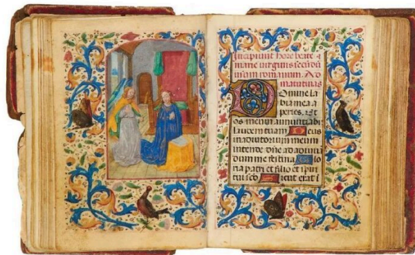
Fig. 5. L' Annunciazione , Libro d'Ore Madruzzo. Inizio della sezione delle Ore della Vergine (Mattutino)

Ma chi era la prima proprietaria del codice?