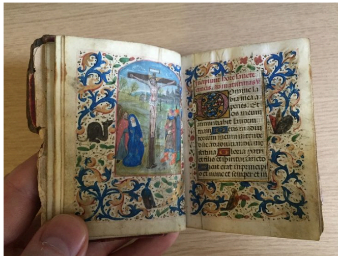
Fig. 1. La Crocifissione , dal Libro d'Ore Madruzzo .

Proprio in questi giorni, sulla piattaforma d'aste online, sono ricomparsi i fogli di un piccolissimo Libro d'Ore, creato nelle Fiandre attorno al 1480 per essere contenuto nella minuta mano di una donna (misurava 90 per 65mm), eppure riccamente decorato, grazie all'utilizzo di lenti d'ingrandimento tipiche degli atelier fiamminghi (Fig. 1).