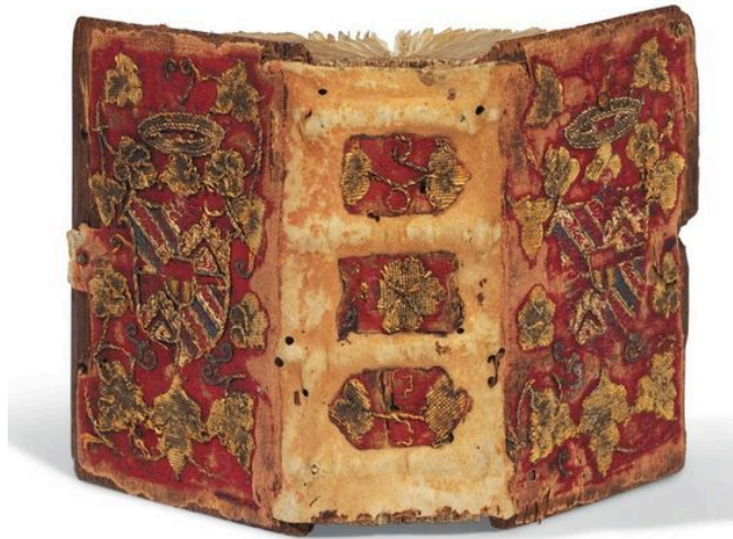
Fig. 2. Il Libro d'Ore Madruzzo , con la rilegatura in tessuto ricamato, prima di venire smembrato.

A Verbania la personale "Celestiale Ytalia" di Ruven Afanador presso la Sala Esposizioni Panizza di Ghiffa dal 9 Novembre al 1 Dicembre).