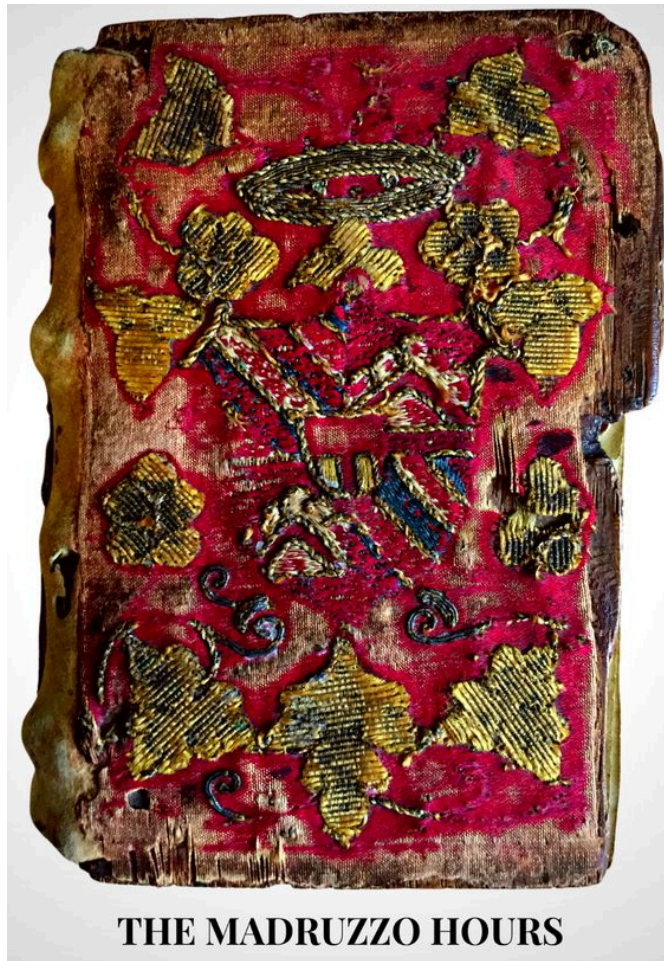
Fig. 3. Il Libro d'Ore Madruzzo, dettaglio dello stemma della famiglia Madruzzo.

Biblioteca Universitaria di Amsterdam, OTM: Band 2Eg, e alla British Library, c46a33.