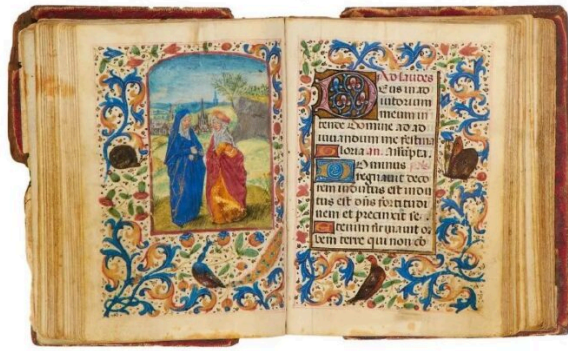
Fig. 4. La Visitazione , Libro d'Ore Madruzzo. Inizio della sezione delle Ore della Vergine (Lodi).