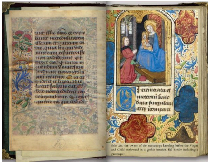
Fig. 3 Ore Guyot, foglio 28r, ricostruzione digitale