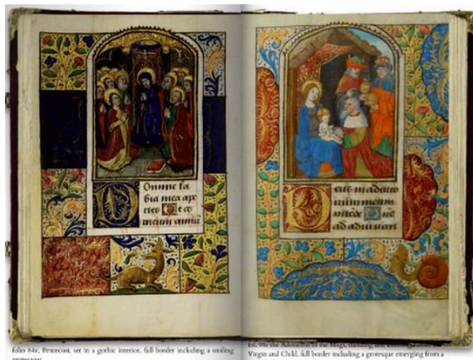
Fig. 5 Ore Guyot, foglio 28r, ricostruzione digitale