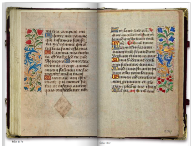
Fig. 4 Ore Guyot, foglio 28r, ricostruzione digitale