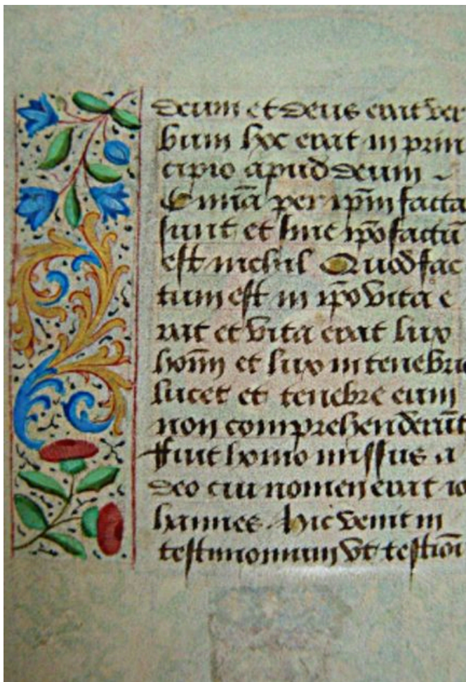
Fig. 2. Ore Guyot, foglio 13 verso

Ricostruendo digitalmente il codice, questo frammento digitale si è rivelato essere il foglio 13 del manoscritto madre.