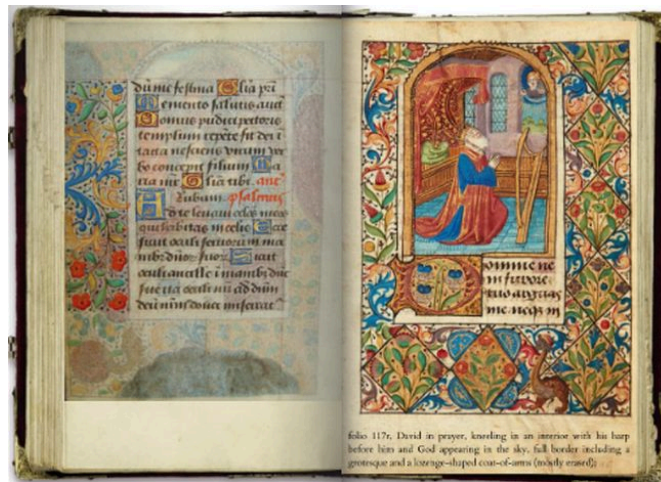
Fig. 6. Ore Guyot, foglio 28r, ricostruzione digitale