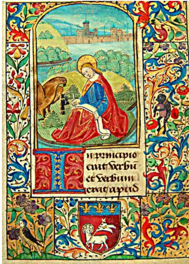
Fig. 1 Ore Guyot, foglio 13 recto

Ho iniziato la mia ricerca partendo da un semplice foglio miniato (Fig. 1), venduto da un commerciante tedesco, seguendo fedelmente ogni passo descritto nel WBRM.